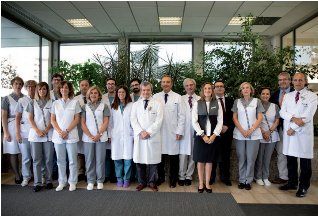
Todos los especialistas del Departamento de Urología, tanto de la sede de Pamplona como de Madrid, en la entrada de la Clínica. El protocolo se va a llevar a cabo en ambos centros.