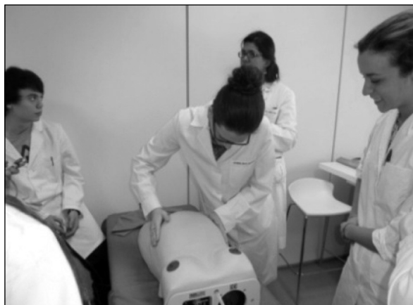
Figura 1. Taller de exploración obstétrica.