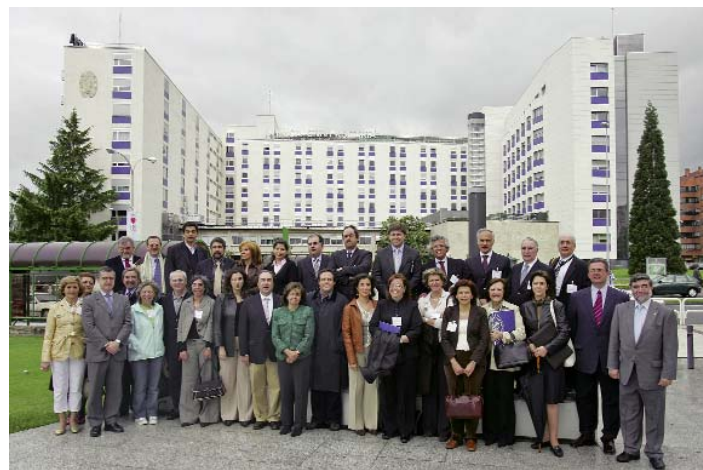
Participantes en la sexta edición del programa.