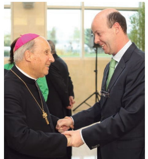
Imágenes del multitudinario funeral de Mons. Javier Echevarría y distintos momentos de su paso por la Clínica Universidad de Navarra.