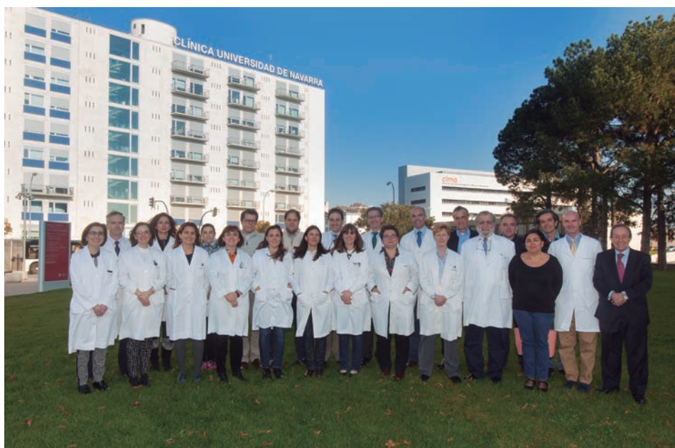
Investigadores de la Clínica, CIMA y Universidad, titulares de las ayudas FIS del Ministerio.

Los becados se centran en hallar mecanismos y nuevos tratamientos contra el cáncer, enfermedades metabólicas y cardiovasculares