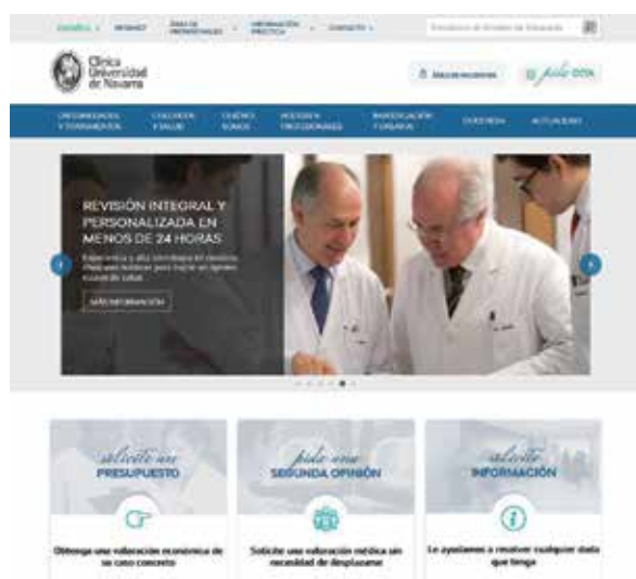
Imagen de la homepage de la Clínica Universidad de Navarra

La Fundación Avedis Donabedian le ha concedido por segunda vez el galardón por su diseño, actualización y abundancia de contenidos