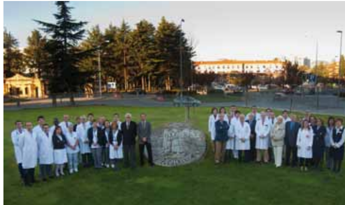
Equipos de la CUN y del CHN del Programa de Trasplante Renal de Navarra.

El trasplante de riñón es el tratamiento más efectivo para las personas con insuficiencia renal grave porque permite la recuperación integral de esta función y el desarrollo de una vida normal. “Supone un cambio importante en la calidad de vida