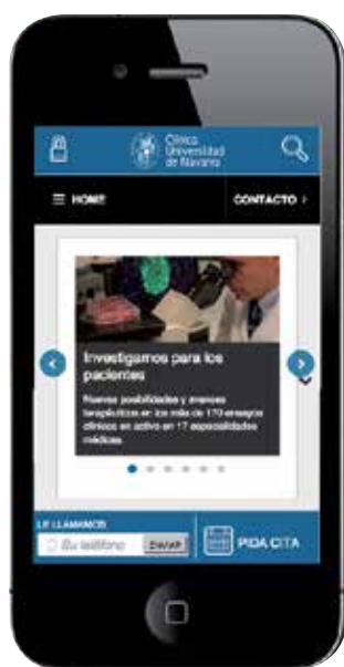
Diferentes aspectos de la nueva interfaz.

El usuario que visita la página de la Clínica accede en su mayoría a través de buscadores, permaneciendo una media de aproximadamente