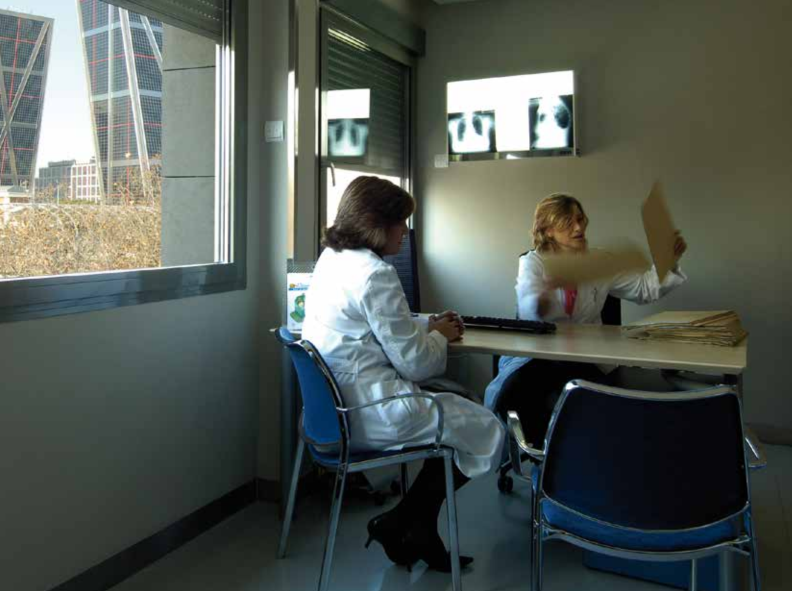
Una de las consultas de la actual Clínica en Madrid, cerca de la Plaza de Castilla.

sin accionariado, no realiza reparto de dividendos, sino que todos sus excedentes se reinvierten en la formación de sus profesionales, en investigación, en tecnología y en proyectos de desarrollo que aseguren la sostenibilidad de la Clínica a medio y largo plazo. El de Madrid es uno de esos proyectos”.