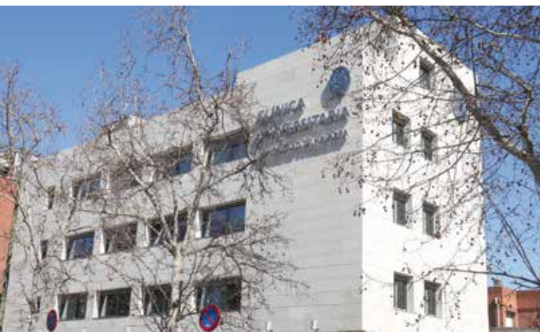
La actual sede de la Clínica en Madrid se encuentra en la calle General López Pozas.

Una destacada señal de identidad de la Clínica Universidad de Navarra, afirma el director general, es que es una institución sin ánimo de lucro, “porque al tratarse de una entidad