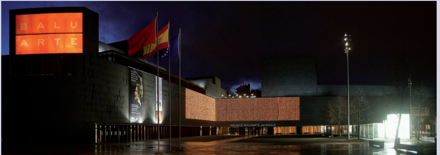
La gala-concierto con que se dio inicio a los actos conmemorativos del 50 aniversario de la Clínica congregó a cerca de 1.500 personas en el Palacio de Congresos y Auditorio "Baluarte" de Pamplona.