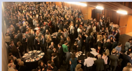
Vista aérea de los asistentes al concierto durante el descanso entre los dos actos del concierto.