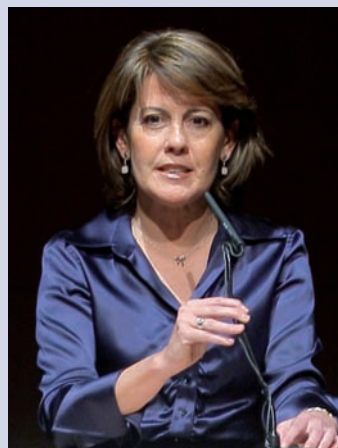
YOLANDA BARCINA ANGULO Presidenta de la Comunidad Foral de Navarra

“Gracias a los acuerdos de la Clínica con hospitales de todo el mundo, el nombre de Navarra se escucha en los más prestigiosos centros hospitalarios internacionales”