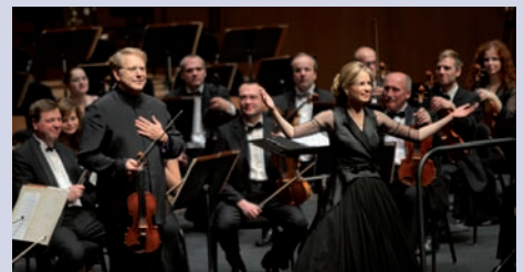
Ovación al final de la primera parte, tras la interpretación de la obra "Aires gitanos" de Sarasate por el violinista Shlomo Mintz.