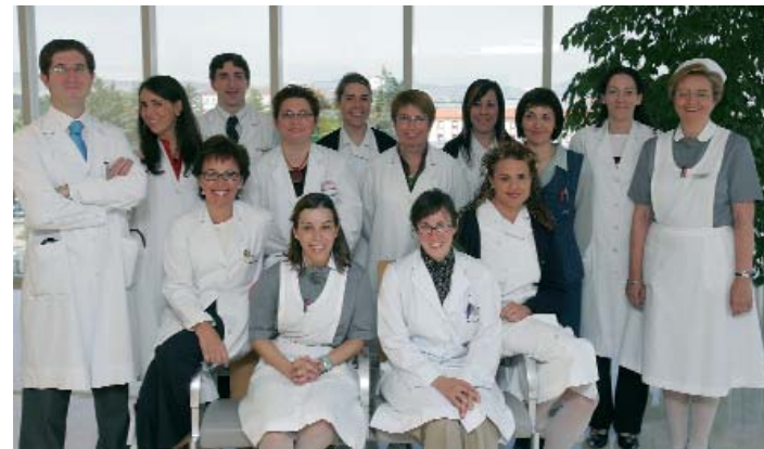
El departamento de Alergología de la Clínica, al completo.