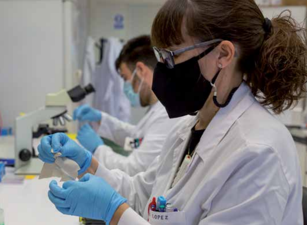
Diferentes fases de investigación básica en el Laboratorio de Tumores Sólidos del Cima Universidad de Navarra.