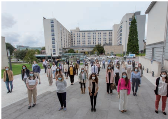
Imagen de la nueva promoción de médicos que inicia su residencia en la Clínica.

Un total de 45 nuevos graduados en Medicina comienzan su período de residencia para adquirir la formación como especialistas