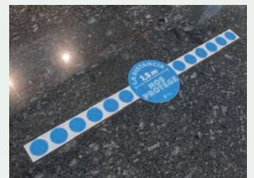
El mantenimiento de las distancias de seguridad cuenta con una señalética específica, tanto en el suelo como en los sillones de las salas de espera.

tiempo, cuenta con espacios independientes y aislados para atender con la máxima seguridad al resto de sus pacientes. Unos circuitos adecuadamente señalizados para que los pacientes puedan moverse por la Clínica con garantía.