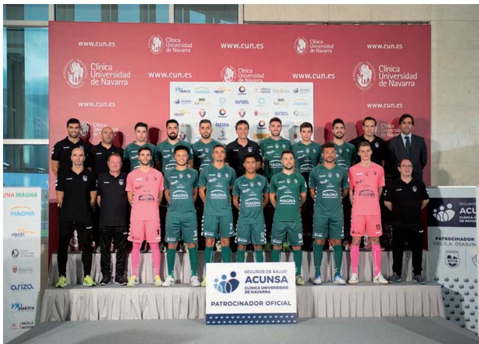
La plantilla y cuerpo técnico del C.A. Osasuna Magna posan en la foto oficial.

El Campus de Pamplona recibió a la plantilla, cuerpo técnico y directivos de la presente temporada