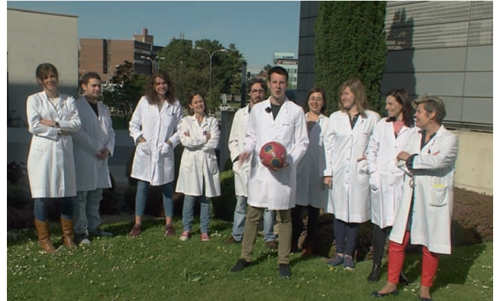
Investigadores del Cima se suman a la campaña de Niños contra el Cáncer.

SUBETU VÍDEO. Twitter e Instagram han sido las plataformas empleadas para lanzar esta campaña y donde se pueden subir los vídeos. ¿Cómo hacerlo? Muy sencillo. Solo hay que seguir a Niños contra el Cáncer en sus cuentas de redes sociales (@NCCancer), adjuntar el