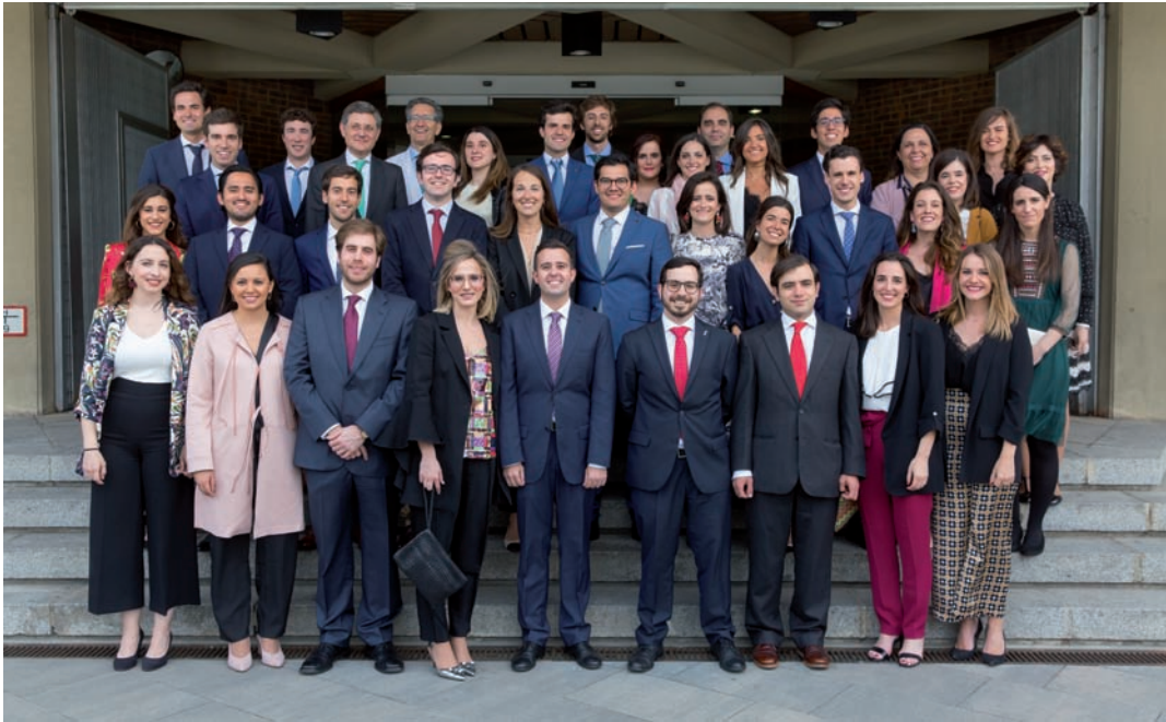
Los recientes especialistas, en su acto de despedida.