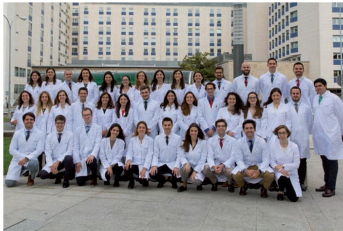
Los nuevos residentes de la Clínica.