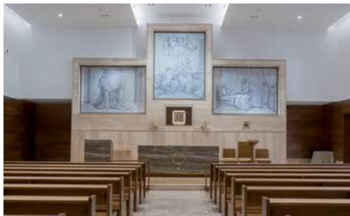
ORATORIO. Abierto al culto para profesionales y pacientes, está situado en la planta -1 y los capellanes están siempre disponibles.