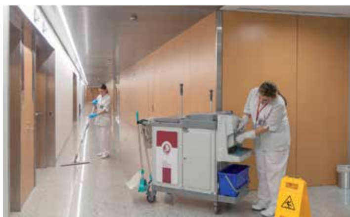
SERVICIO DE LIMPIEZA. Servicio clave en la Clínica, todo su personal forma parte de la plantilla.