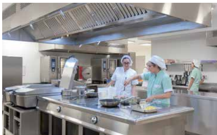
SERVICIO DE DIETAS. De elaboración propia, se encargan de atender los menús específicos de todos los pacientes.