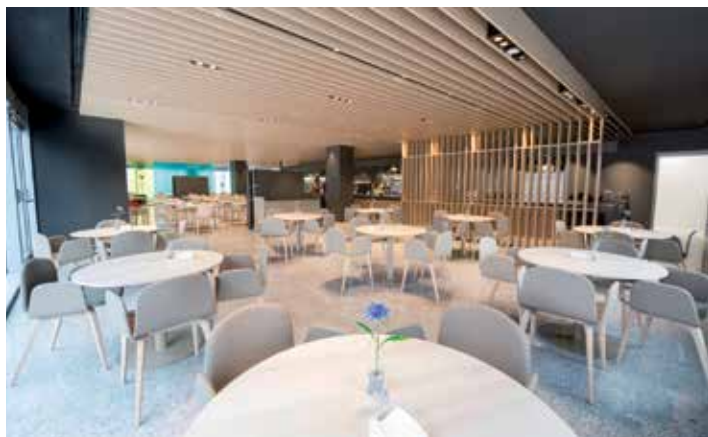
CAFETERÍA. Luminosa y confortable, ofrece a pacientes y familiares un servicio de restaurante y bar durante un amplio horario.

El servicio al paciente es cuidado al detalle. No solo en la asistencia médica o en los procedimientos tecnológicos, sino que la Clínica también presta especial atención a los servicios que hagan su estancia más cómoda. Especialmente, el servicio de dietas, limpieza y lavandería. Una prestación en favor del enfermo que se cuida con mimo, de forma integrada y diferencial.