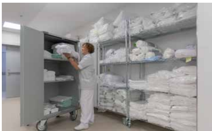
LAVANDERÍA. Como servicio propio, se encarga de lavar tanto la lencería de las habitaciones (sábanas, toallas...) como los uniformes.