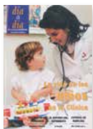
La vida de los niños en la Clínica N°1. Diciembre 1994