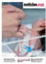
Nueva UCI pediátrica. Luz natural y mayor intimidad. N°58. Octubre 2006