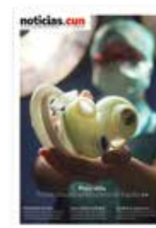
Primer corazón artificial de España N°99. Enero de 2017