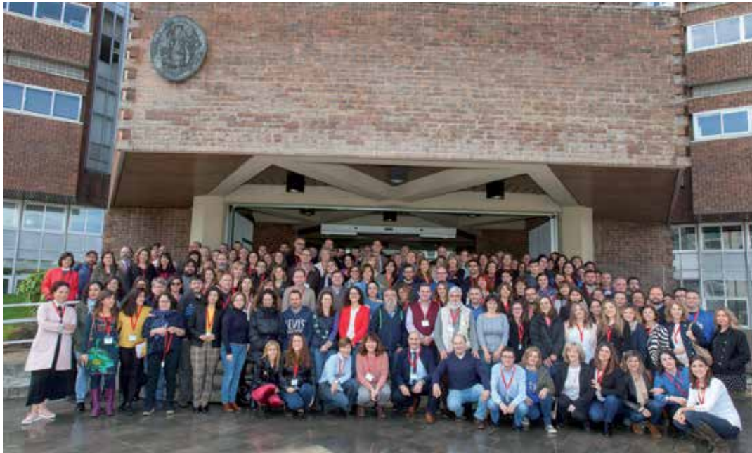
Más de 170 informadores de la salud de toda España, en la Facultad de Ciencias de la Universidad de Navarra.