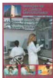
La Clínica Universitaria pone en marcha el Área de Terapia Celular N°38. Diciembre 2000