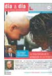
La importancia de la pedagogía en un hospital N°49. Diciembre 2002