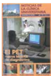
El PET, nueva técnica de diagnóstico N°25. Julio 1996