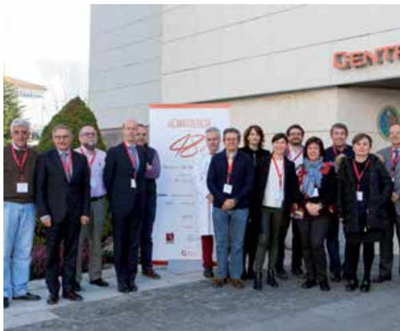
Principales ponentes del curso.

La jornada 'Puesta al día: Hematología en 48 horas' ha incluido las últimas novedades en enfermedades de la sangre