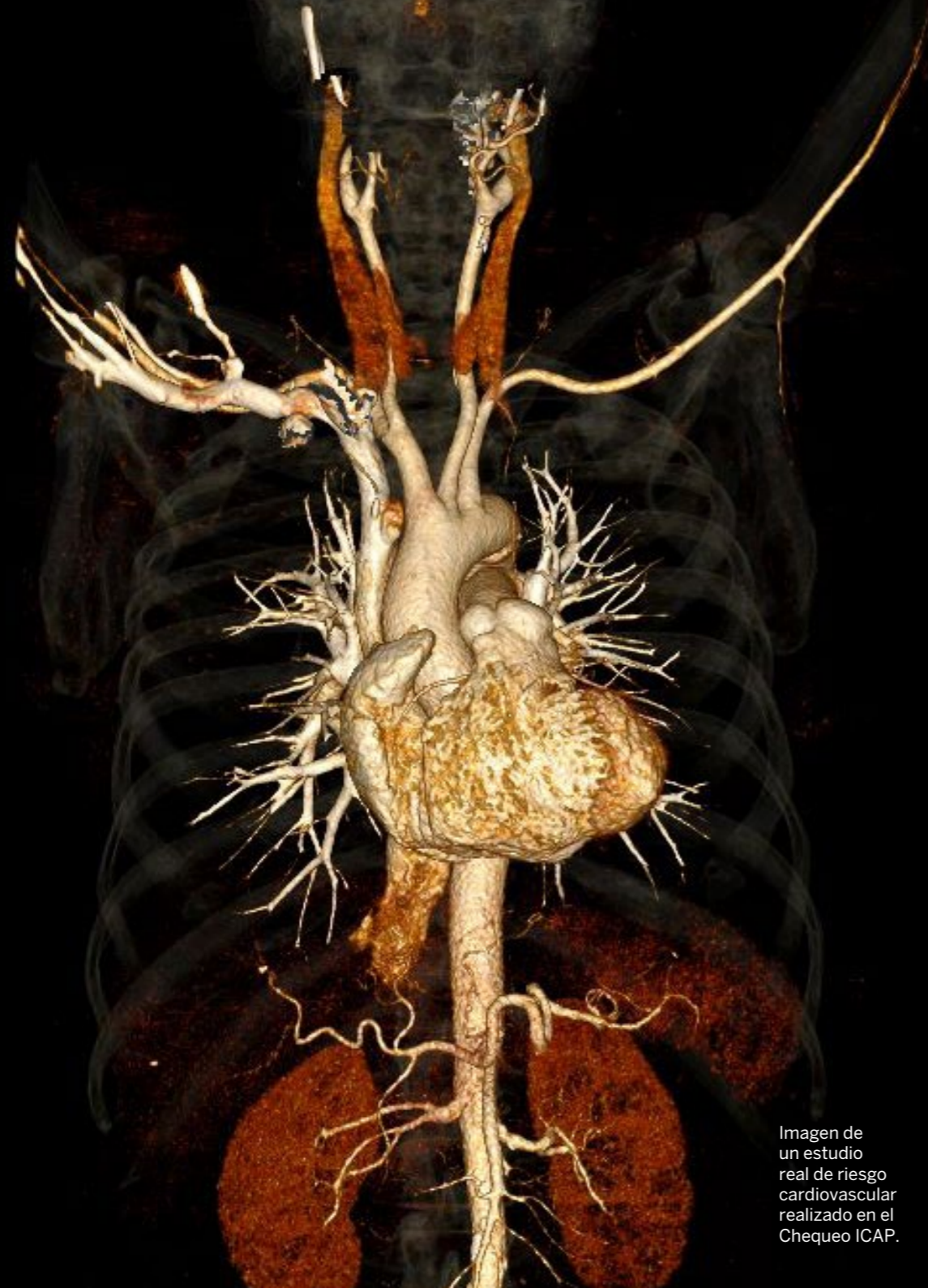
Imagen de un estudio real de riesgo cardiovascular realizado en el Chequeo ICAP.